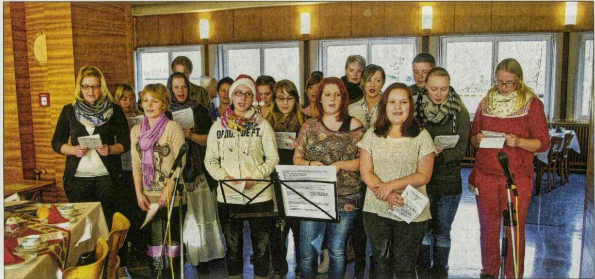
Bestanden den selbstgewählten Praxistest zum Thema Weihnachtsfeier: Angehende Altenpfleger im 2. Lehrjahr in der Berufsfachschule am Mutterhaus Elbingerode bei ihrem Weihnachtsprogramm für ältere Menschen. Es kam zweimal sehr gut an.